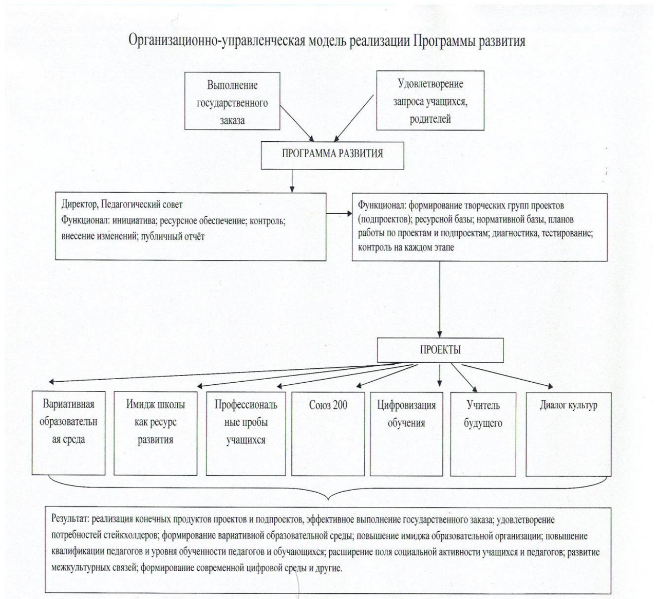
Рис. 3 Организационно-управленческая модель реализации Программы развития